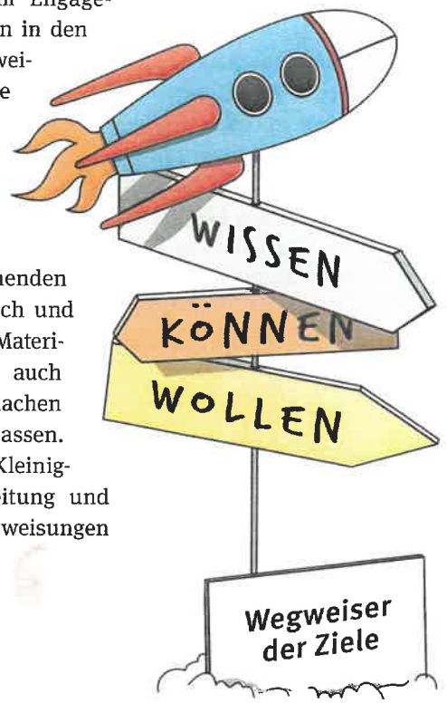
Illustrationen: BGW/Lydia Proft